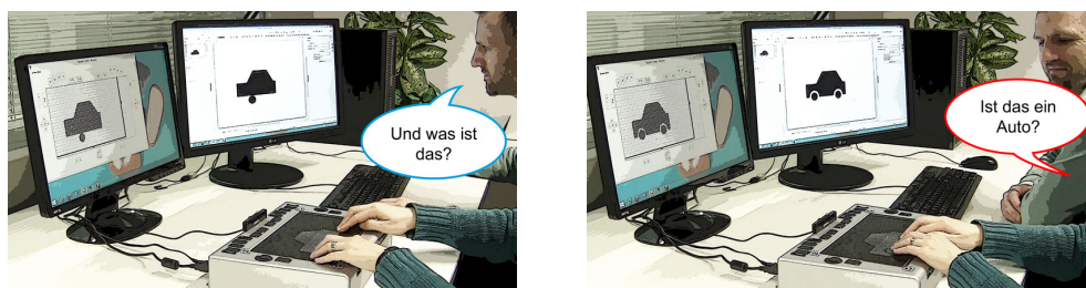
Abbildung 3: Komplexere Objekte: Es können auch komplexere Bilder gemalt werden, welche dann „blind“ erraten werden müssen.