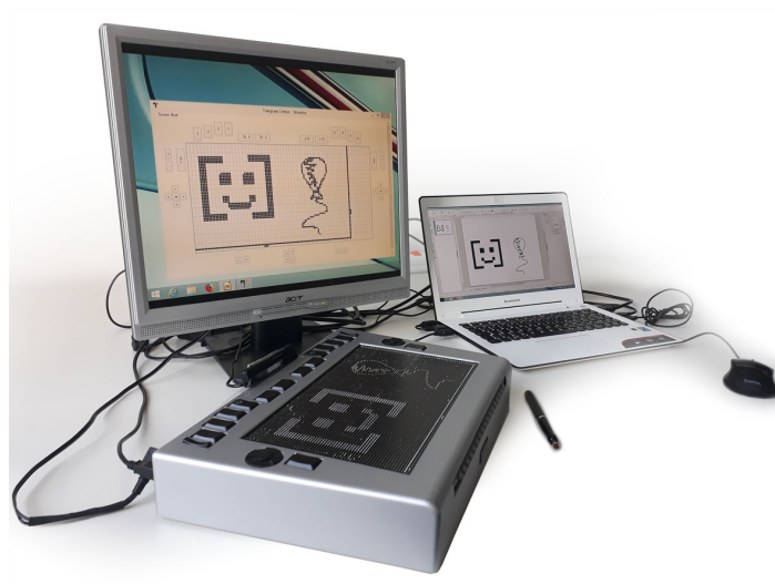
Abbildung 1: Tangram Zeichenarbeitsplatz für LibreOffice DRAW mit Softwaremonitoring für die taktile Darstellung auf einem externen Monitor, BrailleDis 6240 Display für die taktile Ausgabe und Digitalisierungsstift für Freihandzeichenoperationen.

Nur wenige Systeme existieren, die blinde Nutzer als Autoren von Grafiken adressieren (J. Bornschein und Weber, 2017). Deren Funktionsumfang ist zudem oft auf Spezialgebiete, wie Mathematik oder spezielle Diagrammtypen, begrenzt. Die Vorteile von computergestützten Zeichenanwendungen – Unterstützung beim Zeichnen von Objekten (Standardformpaletten, Beautification, etc.) oder das Korrigieren von Fehlern beziehungsweise das nachträgliche Verändern von Zeichnungen – bleiben oftmals nur sehenden Nutzern zugänglich.