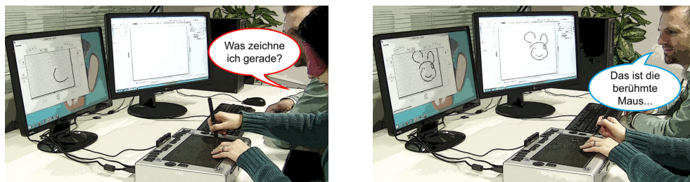
Abbildung 4: Blindes Malen mit dem Stift: Als letzte Herausforderung besteht die Möglichkeit, mit verbundenen Augen ein Bild auf dem taktilen Display zu zeichnen, welches dann durch den sehenden Mitspieler erraten werden muss.